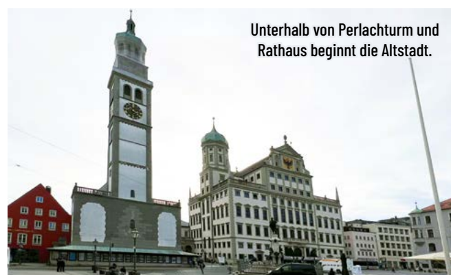
Unterhalb von Perlachturm und Rathaus beginnt die Altstadt.

Fudulis sucht im breiten Angebot gleich mal die passende Wohnung zum Märchenprinz, mit genügend Auslauf für das weiße Pferdchen. Dies hätte das Layer-Team natürlich in petto, sie muss dann aber auf Intervention meinerseits, ihr Luftschlösschen platzen lassen und von dannen ziehen. Unsere Wallfahrt in diesen wunderbare Teil der Fuggerstadt findet ein Ende. Und es bleibt nur noch zu sagen: „Die Altstadt ist schön bei Nacht und Tage. Wir kommen gerne wieder, keine Frage! Einen Shoppingbummel abseits der großen Massen, kann man erleben in diesen Gassen. Und die Geschäfte Groß und Klein, laden zum Verweilen ein.“ Bis bald in einem anderen Stadtteil oder einem Städtchen der Region, Eurer Business-Walker freut sich schon.