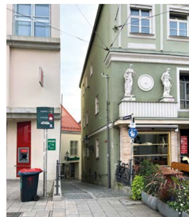
Von der Maximilianstraße über den Judenberg in die schöne Altstadt.

Fudulis sucht im breiten Angebot gleich mal die passende Wohnung zum Märchenprinz, mit genügend Auslauf für das weiße Pferdchen. Dies hätte das Layer-Team natürlich in petto, sie muss dann aber auf Intervention meinerseits, ihr Luftschlösschen platzen lassen und von dannen ziehen. Unsere Wallfahrt in diesen wunderbare Teil der Fuggerstadt findet ein Ende. Und es bleibt nur noch zu sagen: „Die Altstadt ist schön bei Nacht und Tage. Wir kommen gerne wieder, keine Frage! Einen Shoppingbummel abseits der großen Massen, kann man erleben in diesen Gassen. Und die Geschäfte Groß und Klein, laden zum Verweilen ein.“ Bis bald in einem anderen Stadtteil oder einem Städtchen der Region, Eurer Business-Walker freut sich schon.