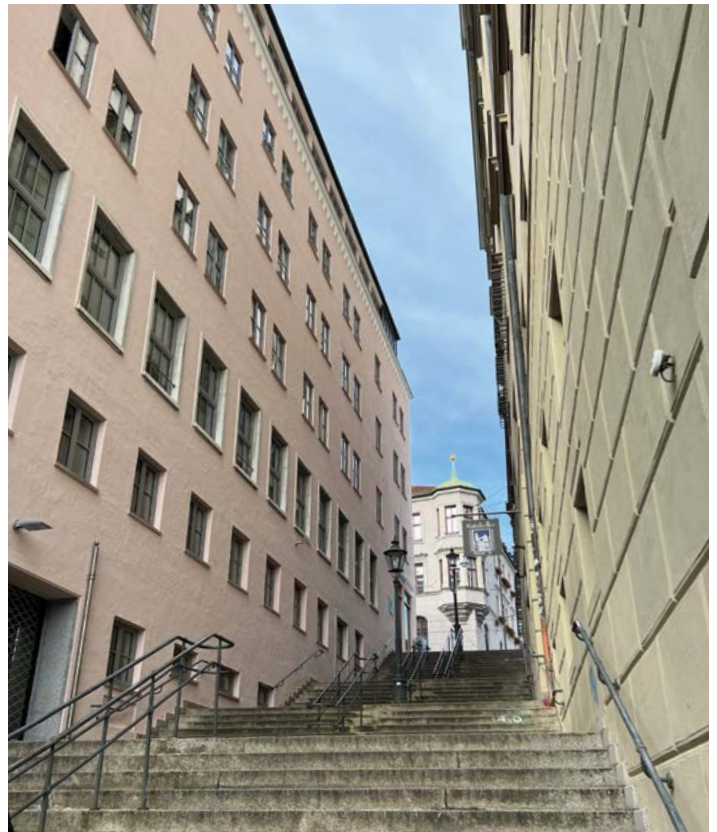
Eine der „Pforten zur Altstadt“, die 57 Treppen am Augsburger Rathaus.

Und wieder war unsere „Azubine“ verschwunden, angezogen wohl von den geschmackvollen Produktpräsentationen, die unaufdringlich, aber das Auge erfreuend, in Szene gesetzt werden. Dass das Unternehmen ganz besonders auf einen sparsamen Einsatz der Ressourcen und einen schonenden Umgang mit der Natur achtet, darf hier noch