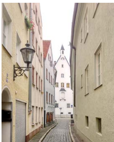
Enge Gassen und viel Flair.

Schon nach kurzer Wegstrecke, wir laufen quasi direkt darauf zu, eine weitere Pforte. Dieses Mal führt sie in ein wahres Himmelreich für die Damen. „Mode im LUSTGARTEN“ prangt in großen Lettern auf der Fassade und ein begrünter Gang führt uns in das Innere, das Modeherz der Damenwelt. Ein Lustgarten ist ein (oft parkähnlicher) Garten, der vorrangig Erholung und dem Erfreuen der Sinne dient. Nun, die Sinne werden hier vortrefflich bedient. Wunderschöne Räume, stimmige Dekorationen, das Plätschern eines Brunnens sowie eine gelungene Präsentation von Damenmode in völlig entspannter und privater Atmosphäre. Man wandelt von Raum zu Raum und entdeckt stets Neues. Wir waren von der Größe dieses Mode-Juwels mehr als überrascht. Selbst an Chill-