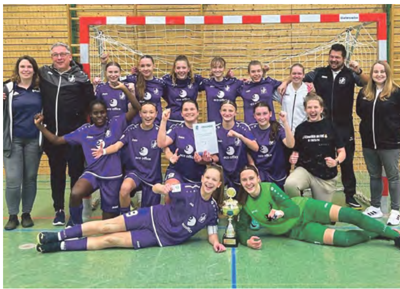
Die siegreichen U17-Juniorinnen des TSV Schwaben Augsburg.

Augsburg. Ein knapper 1:0 Sieg des TSV Schwaben reichte zum Einzug ins Finale. Dort musste dann ein Strafstoßschießen entscheiden. Die Mädels des TSV sicherten sich durch einen 4:2 Sieg über den VfB Durach auch hier den Titel. Das Bayerische Finale findet nun am 17. Februar in Regensburg statt.