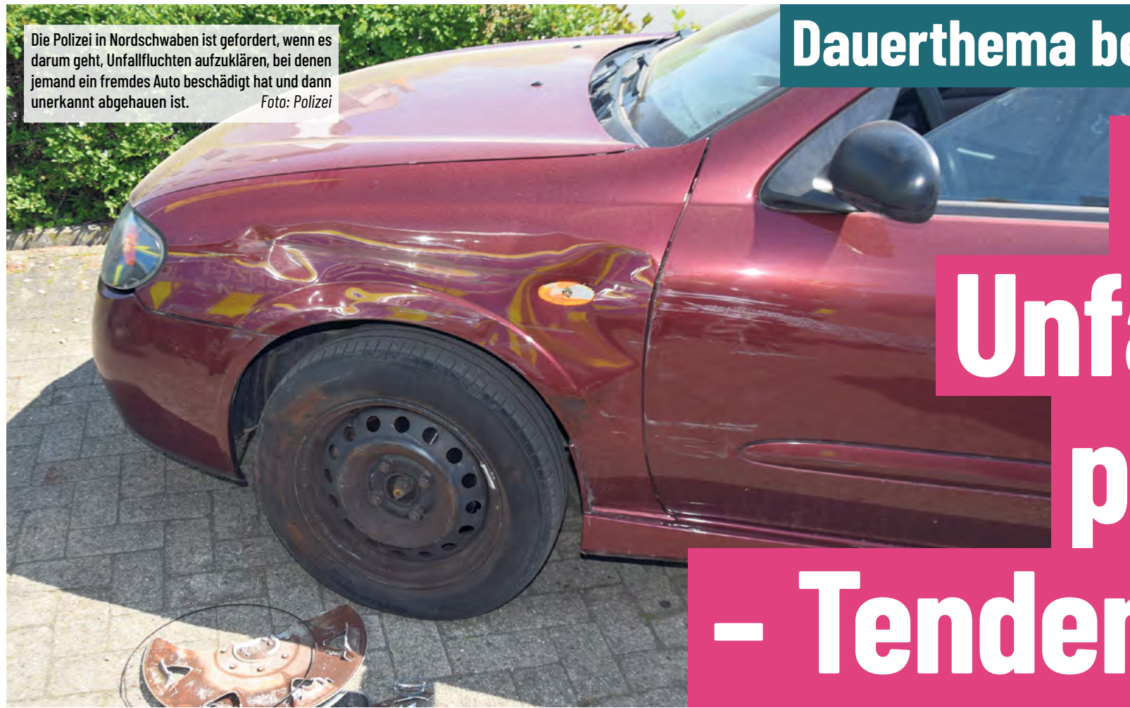
Die Polizei in Nordschwaben ist gefordert, wenn es darum geht, Unfallfluchten aufzuklären, bei denen jemand ein fremdes Auto beschädigt hat und dann unerkannt abgehauen ist.