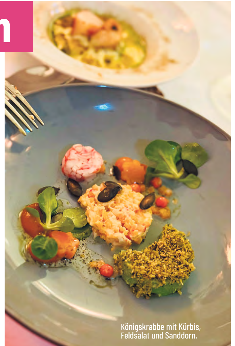
Königskrabbe mit Kürbis, Feldsalat und Sanddorn.