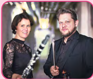
Die Augsburg-Nürnberger Kammerkonzerte im Parktheater Göggingen.

• Vivaldis Vier Jahreszeiten im Klimawandel, Harald Lesch (Erzähler) & Das Merlin Ensemble Wien, Stadthalle Gersthofen, 17 Uhr