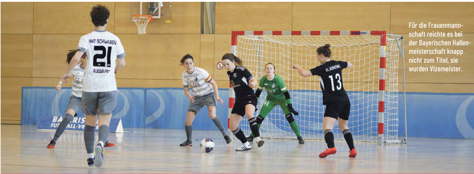
Für die Frauenmannschaft reichte es bei der Bayerischen Hallenmeisterschaft knapp nicht zum Titel, sie wurden Vizemeister.