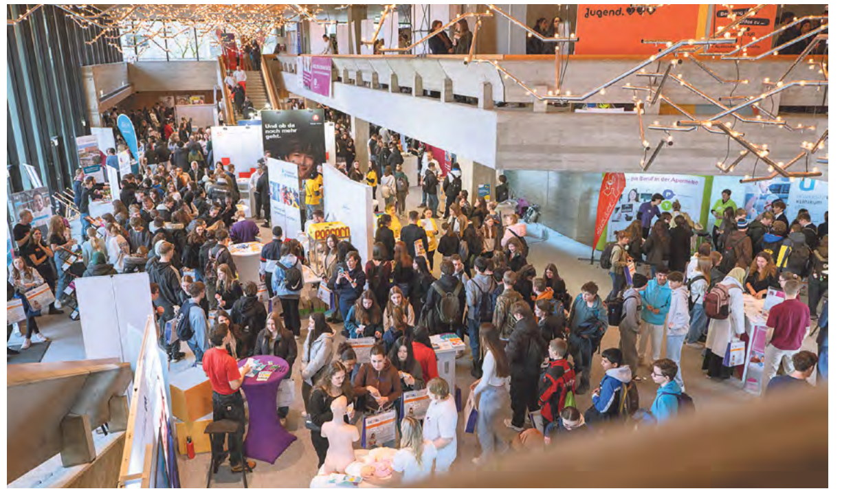
Erstmals fanden sich über 2800 Studierende, Schüler aller Schularten und erfahrene Fachkräfte auf der GEZIAL Messe im Kongress am Park ein. Damit brach die branchenspezifische Karrieremesse in diesem Jahr ihren Besucherrekord.