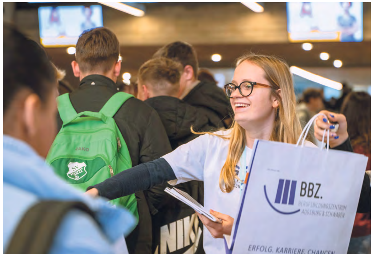
Auch für Aussteller war die Messe ein voller Erfolg. Engagierte Mitarbeiter führten Gespräche mit potenziellen neuen Kollegen, um diese von der Arbeit ihres Unternehmens zu überzeugen.