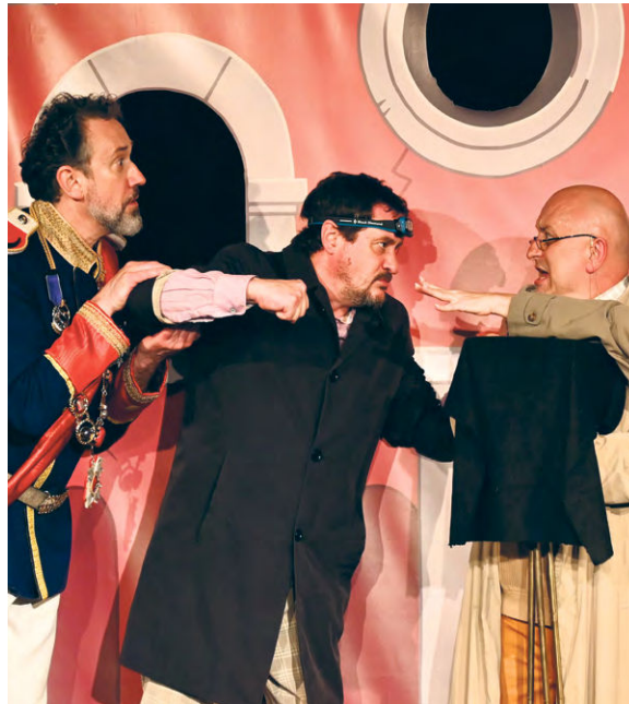
Mit „Selbstportraits“ begeistert das Sensemble Theater sein Publikum.

● Selbstportraits, Theaterstück des Sensemble Theaters, Bergmühlstraße, 20.30 Uhr