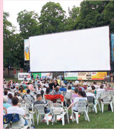
Das Lechflimmern im Plärrerbad ist jedes Jahr sehr beliebt.

Kino 2: Die Herrlichkeit des Lebens, Familienbad am Plärrer, Schwimmschulstraße, 20 Uhr