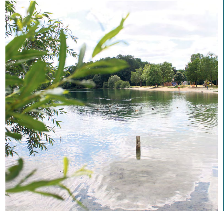
Bei der Wassertour durch Augsburg lernt man vieles über unsere Wasserstadt.