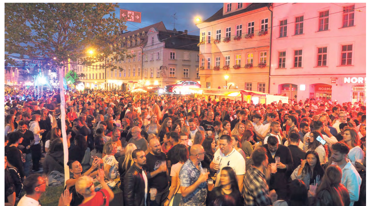
Volle Innenstadt bei den Sommernächten 2023.