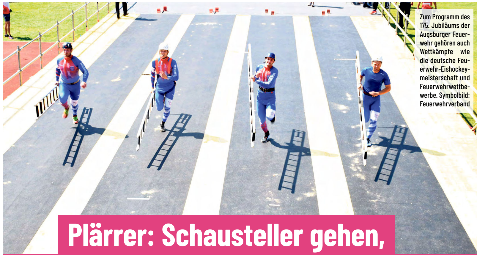
Zum Programm des 175. Jubiläums der Augsburger Feuerwehr gehören auch Wettkämpfe wie die deutsche Feuerwehr-Eishockeymeisterschaft und Feuerwehrwettbewerbe.