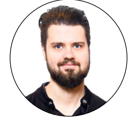
Von Johannes Kaiser Sportredakteur