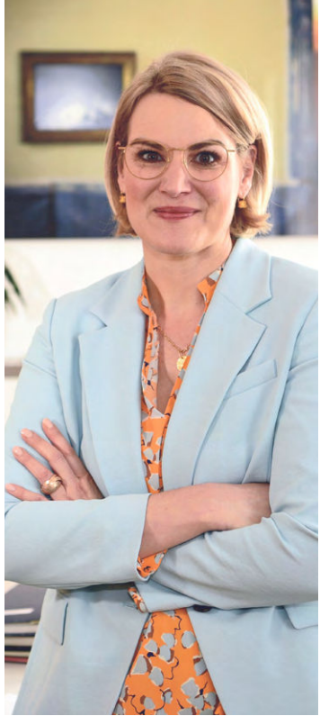
Von OB Eva Weber

Es kommt Bewegung ins Thema Schienenverkehr: einmal beim Bahnausbau Ulm-Augsburg und einmal beim Ausbau der Straßenbahninfrastruktur im Stadtgebiet. Drei Gedanken dazu.