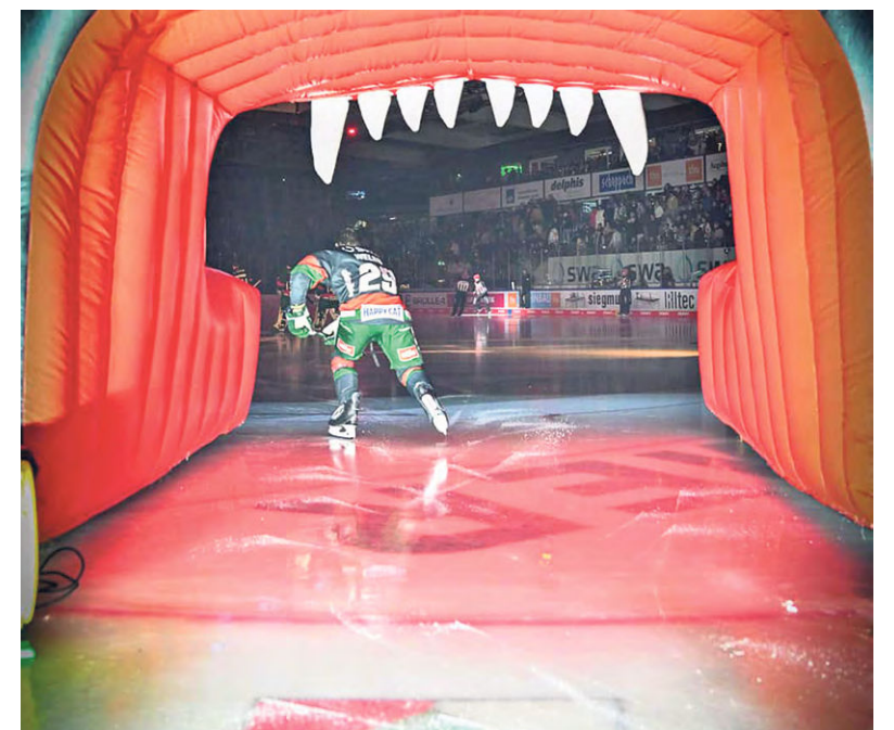
Die Panther in der vergangenen Saison beim Heimspiel gegen Wolfsburg.

Für die Niedersachsen bestritt Zajac 115 Liga- und acht CHL-Spiele. In der DEL stellte er seine Fähigkeiten als offensiv- und laufstarker Abwehrspieler mit zehn Toren und 49 Assists in den beiden vergangenen Spielzeiten unter Beweis. In seiner ersten Deutschland-Saison war Zajac unter den sieben Verteidigern mit den meisten Scorerpunkten der Liga. Als Vielspieler erhielt der 178 cm große und 84 kg schwere Panther-Neuzugang auch in der letzten Saison mit durchschnittlich 23:14 Minuten Eiszeit pro Partie viel Vertrauen seiner Trainer.