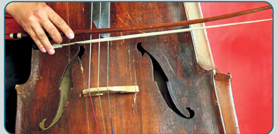
Gemeinsames Musizieren im alten Rockcafé - Ein Treff für Augsburger Musiker.

● Open Music Session, Community Music, egal, ob du seit Jahren im Orchester spielst oder zum ersten Mal ein Instrument in die Hand nimmst - bei der OPEN MUSIC SESSION sind alle willkommen, mit Geige, Darbuka oder einem anderen Instrument deiner Wahl, Altes Rock Café, 19.30 Uhr