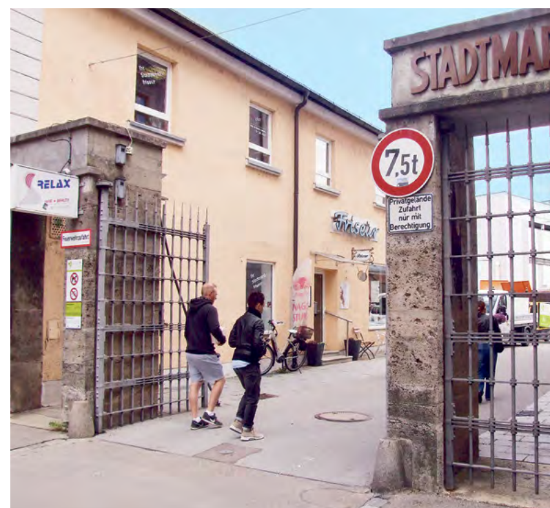
Bislang ist es so, dass, wenn der Augsburger Stadtmarkt schließt, schmiedeeiserne Tore gesperrt werden (li.) und das Gelände komplett unzugänglich ist.