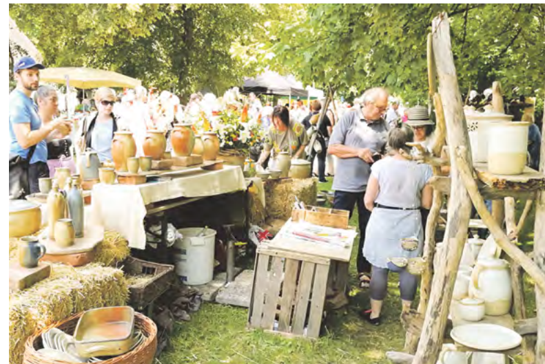
Die Arbeiten für den Töpfermarkt entstehen alle in den Werkstätten der Aussteller.