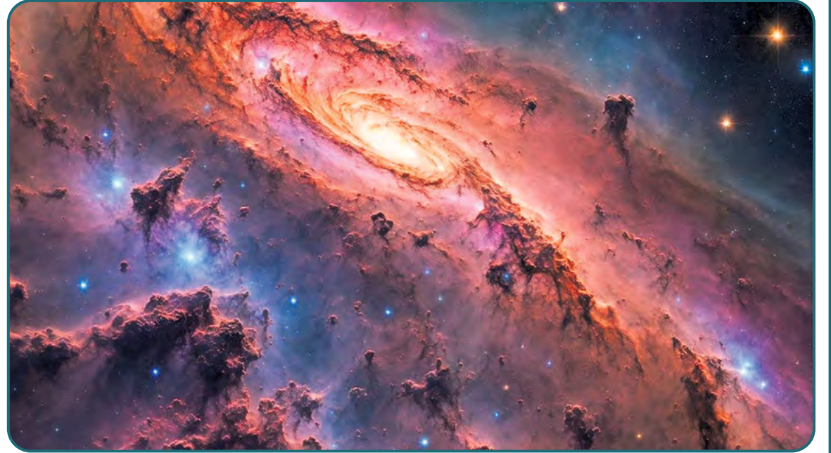
Das Planetarium in Augsburg erklärt die Astronomie und Wissenschaft.