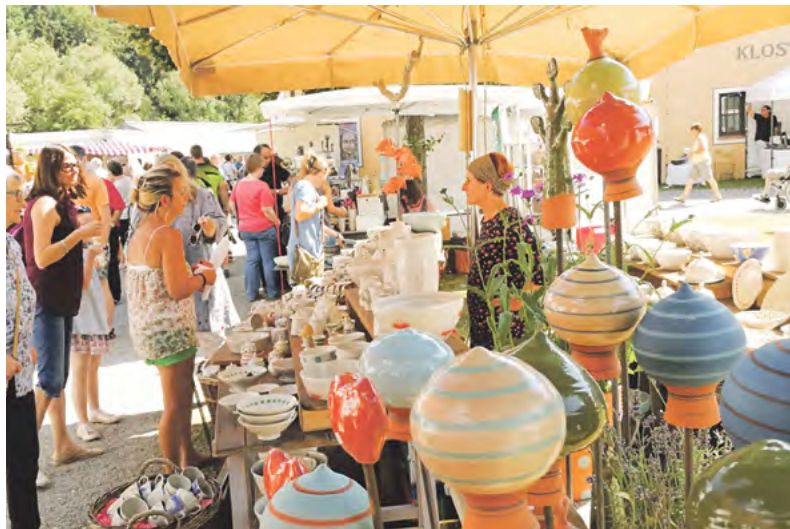
Gartendekoration in allen Farben gibt es auf dem Töpfermarkt Oberschönenfeld.