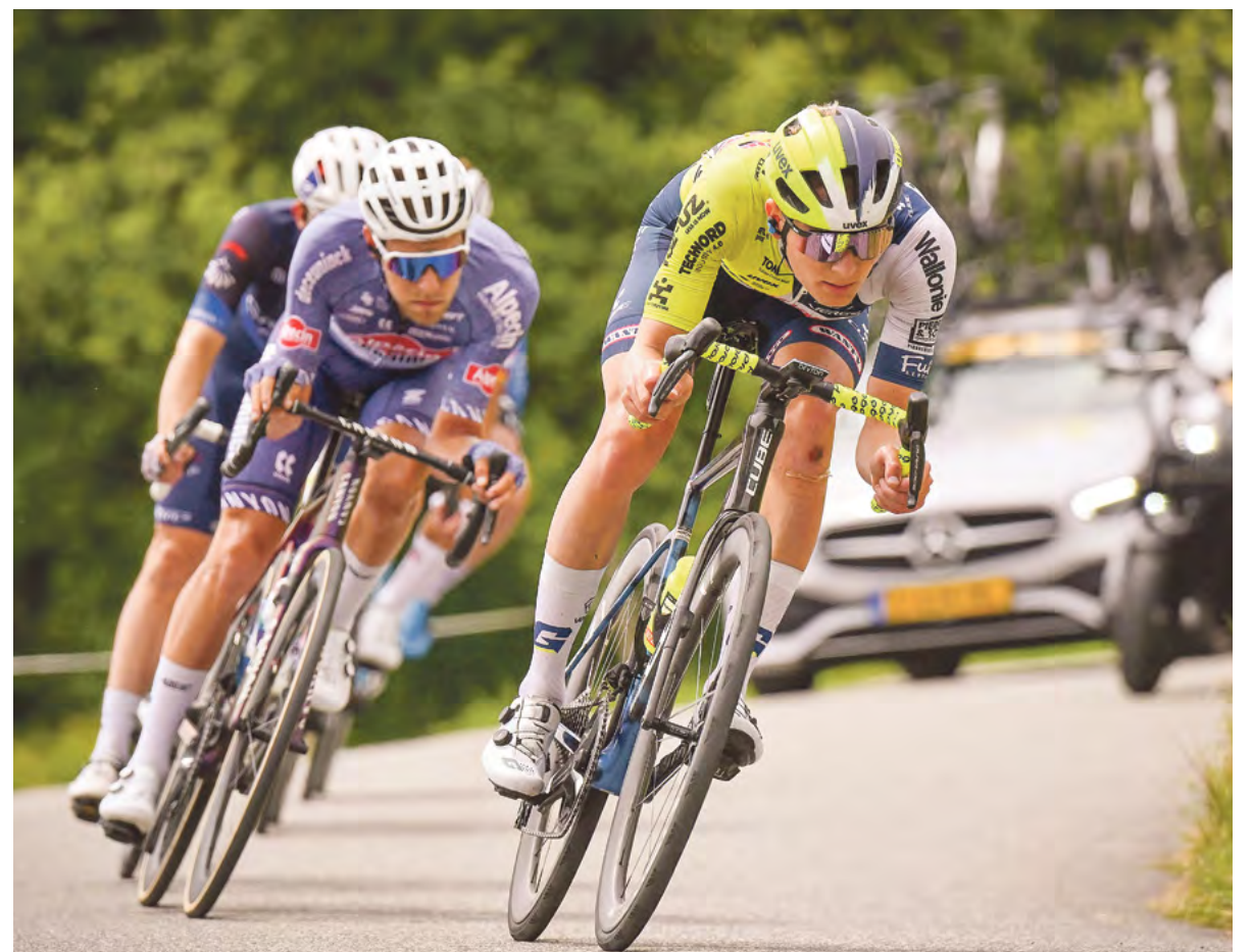
Sich mit einer Ausreißergruppe bis ins Ziel retten. Fast hätte es im letzten Jahr so mit einem Etappenerfolg geklappt.

Zimmermann: Das hat sich auf jeden Fall gelohnt. In diesem Jahr ist er richtig gut unterwegs, ist wieder sportlich erfolgreich. Daher war es der genau richtige Schritt.