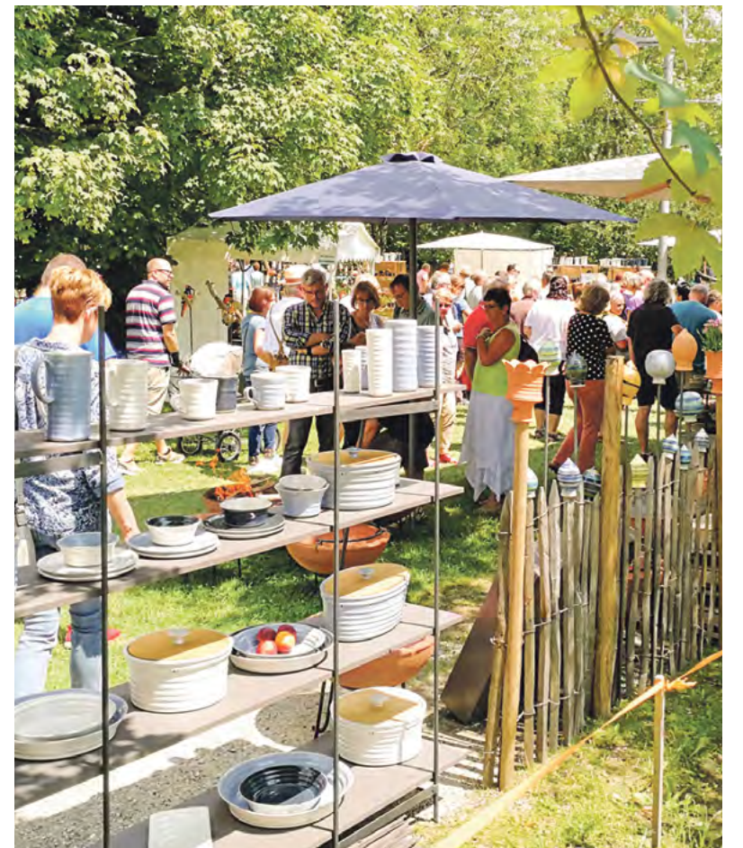
Beim Töpfermarkt sind auch Gefäße für den täglichen Gebrauch zu erwerben.