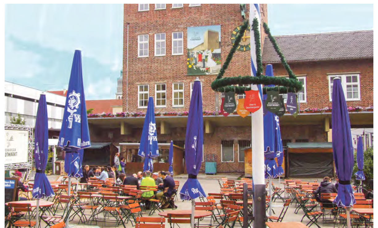
Was in München auf dem Viktualienmarkt geht, das könnte bald auch in Augsburg (unser Bild) möglich sein: Menschen verweilen im Biergarten, während andere Stände schon geschlossen haben.