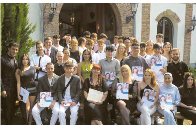
Strahlende Gesichter bei der Freisprechungsfeier der Hotel- und Gastgewerbe-Berufsabsolventen im Ringhotel Alpenhof.