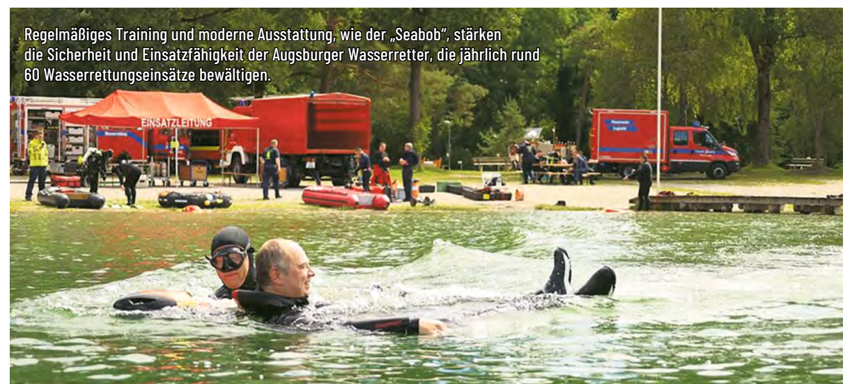
Regelmäßiges Training und moderne Ausstattung, wie der „Seabob“, stärken die Sicherheit und Einsatzfähigkeit der Augsburger Wasserretter, die jährlich rund 60 Wasserrettungseinsätze bewältigen.