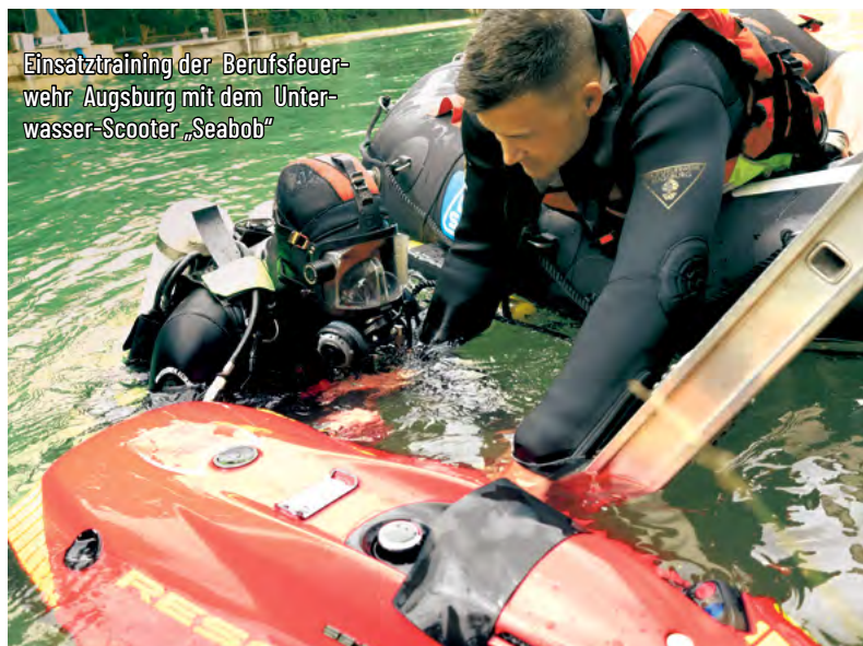
Einsatztraining der Berufsfeuerwehr Augsburg mit dem Unterwasser-Scooter „Seabob“