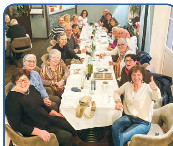
Wir würden uns freuen, dich in unserer lebensfrohen, aktiven Gemeinschaft begrüßen zu dürfen.

• Gemeinnütziger Verein • Träger der freien Jugendhilfe • Um Aus- und Fortbildungen zu finanzieren sind wir auf finanzielle Unterstützung angewiesen • Spendenkonto Stadtparkasse München, IBAN: DE37 7015 0000 1001 6805 76