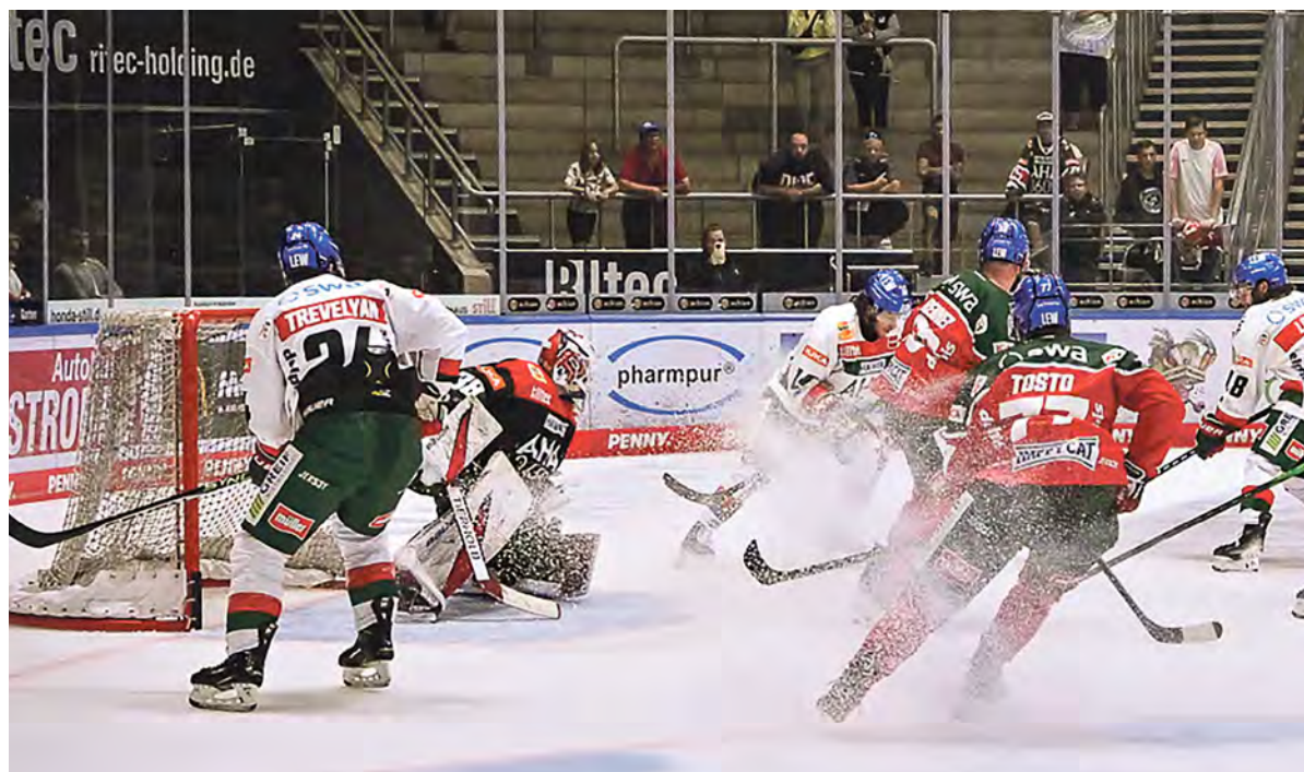
Der Phase der Trainingsspiele „Augsburger Panther gegen Augsburg Panther“ folgt dieser Tage die Phase der Testspiele wie jetzt in Meran, bevor die Augsburg Panther am Donnerstag, 19. September, die neue DEL-Spielzeit eröffnen - gegen die Ingostädter Panther.