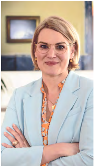
Von OB Eva Weber

Die Tage werden kürzer, der August ist vorbei, und das bedeutet: Die Bayerischen Sommerferien neigen sich dem Ende zu, und nächste Woche beginnt die Schule in Augsburg wieder. Drei Gedanken dazu.