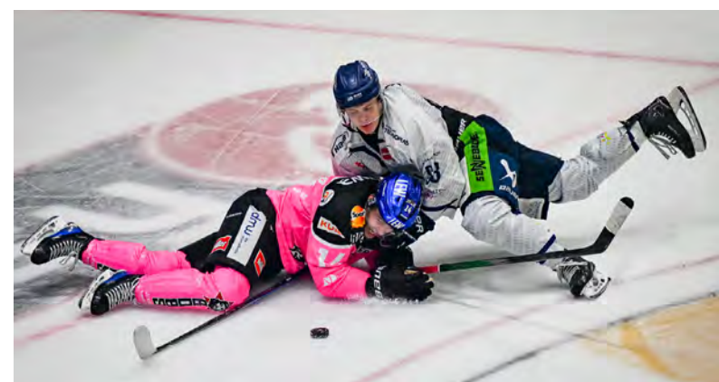
Trotz großem Kampf wollte gegen Straubing einfach kein Tor fallen.

Bereits am Donnerstag wartet auf den AEV das nächste wichtige Auswärtsspiel, beim derzeit abgeschlagenen Tabellenabschlusslicht der Düsseldorfer EG. Zum nächsten Heimspiel empfangen die Panther am Sonntag um 14 Uhr den deutschen Vizemeister, die Fischtown Pinguins aus Bremerhaven.