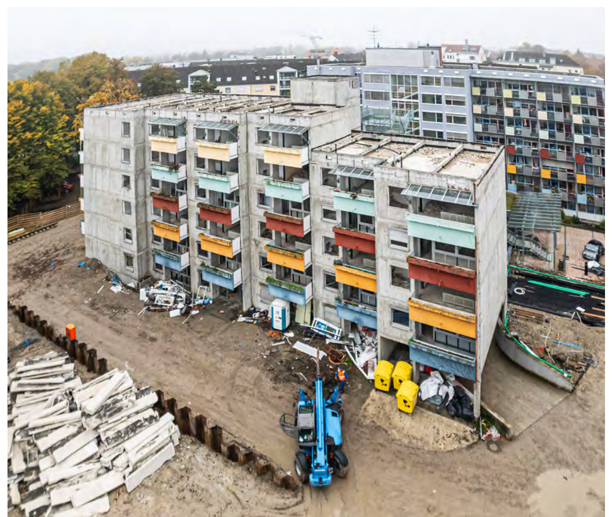
Die Betreute Wohnanlage des Sparkassen-Altenheims wird abgerissen, der Ersatzbau soll bis 2026 fertig sein.

Das vollständige Programm und weitere Informationen sind auf der Website des UKA unter www.uka-augsburg.de/career-camp verfügbar.