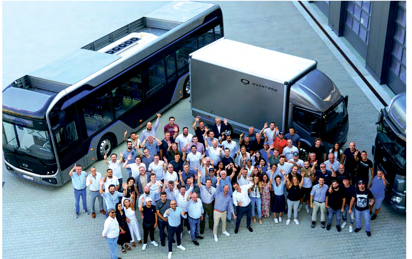
Freudig, ja euphorisch winkte ein Teil der Mitarbeiter von Quantron auf diesem Foto aus dem Vorjahr in die Kamera.