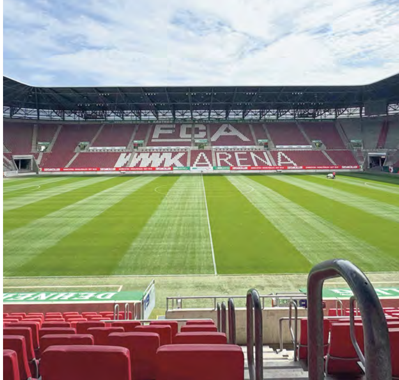
Wer einmal mit bestem Blick von der Haupttribüne aus ein FCA-Heimspiel verfolgen will, nimmt an unserer Verlosung für VIP-Tickets gegen Hoffenheim teil.