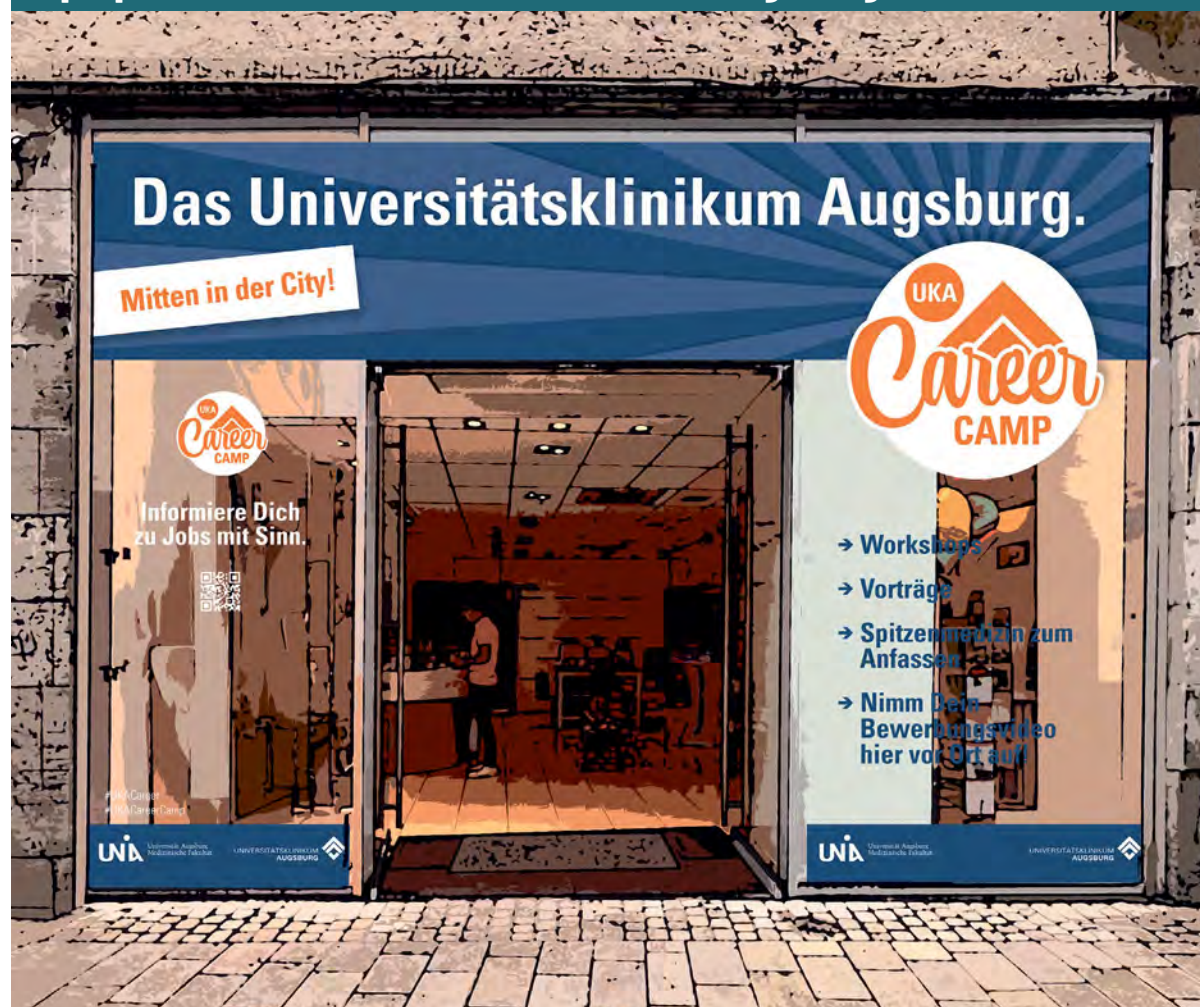
Das „UKA Career Camp“ im Pop-Up-Store in der Annastraße bietet ab dem 2. November 2024 vier Wochen lang spannende Einblicke in die Welt der Spitzenmedizin und Karrierechancen im Gesundheitswesen.