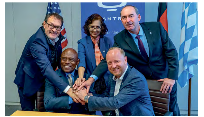
Ein stolzer Moment aus der Vergangenheit: die Vertragsunterzeichnung eines Großauftrags für Quantron aus den USA.