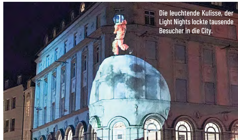
Die leuchtende Kulisse, der Light Nights lockte tausende Besucher in die City.

Auch das Wetter zeigte sich gnädig und trug seinen Teil zu den gelungenen Abenden bei. Die Light Nights erwiesen sich einmal mehr als Publikumsmagnet und unvergessliches Event im Herzen der Stadt.