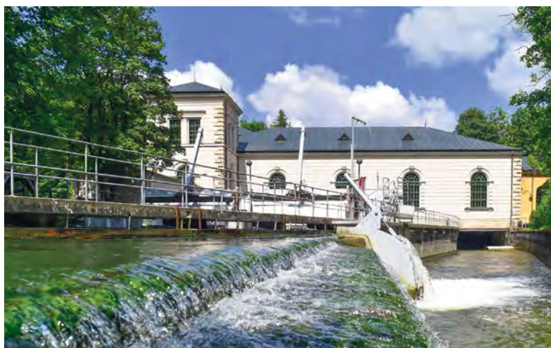
Bei der freien Besichtigung öffnet das historische Wasserwerk seine Tore. Per Audioguide oder geführter Tour gibt es hier die Geschichte des Augsburger Trinkwassers zu erleben.