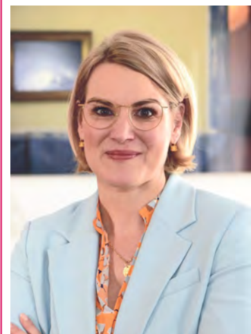
Von OB Eva Weber

Der Herbst ist da – und mit ihm eine liebgewonnene Tradition: Noch bis zum 27. Oktober findet in Lechhausen die Kirchweih statt. Eine wunderbare Gelegenheit, um gemeinsam zu feiern und gleichzeitig einen genaueren Blick auf diese Tradition zu werfen. Drei Gedanken dazu.