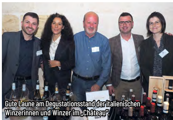
Gute Laune am Degustationsstand der italienischen Winzerinnen und Winzer im „Château“.