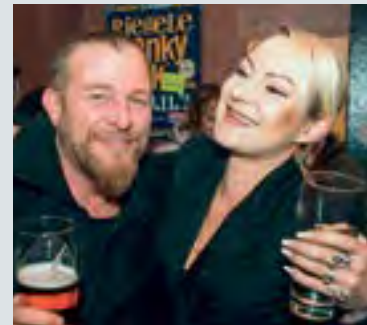
Auch im „Bob's“ wurde wild gefeiert.

bei „Singsation meets Anna-Brass“ in der St. Anna Kirche. Und ob krachender Hardrock in Bob's Punk Rock Pizzeria, karibisches Flair in der Soho Stage mit kubanischer Jodel-Einlage, Bella Italia Stimmung in der Bar Italy, Swing vom Feinsten im Hep Cat Club oder Easy Listening Tunes im Heyzel Coffee – hier kamen wirklich alle Gute-Laune-Fans auf ihre Kosten.