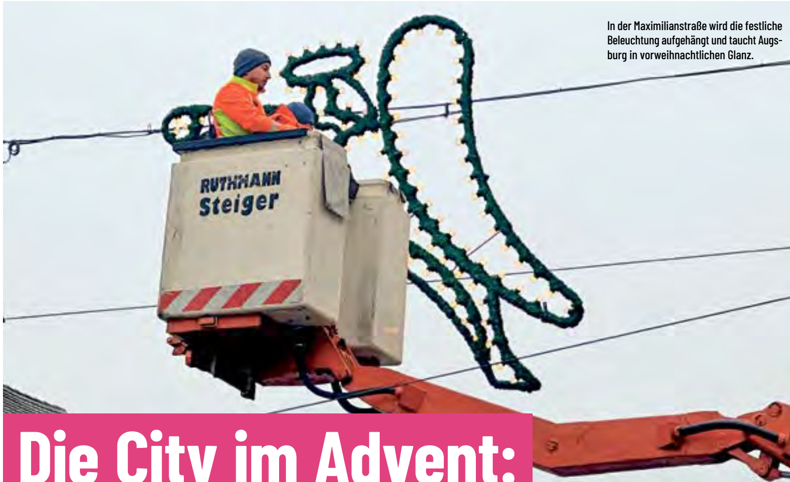
In der Maximilianstraße wird die festliche Beleuchtung aufgehängt und taucht Augsburg in vorweihnachtlichen Glanz.