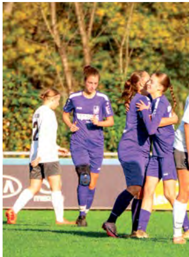
Beim Spiel der Schwaben-Frauen gegen den VfB Stuttgart werden auch zwei ehemalige Nationalspielerinnen auf dem Feld stehen.

1. FFC Hof feiern, der sie in der Tabelle vor die Relegationsränge beförderte. Vergangenes Wochenende unterlagen sie aber im Spiel gegen die U20 der TSG Hoffenheim (Platz 2 in der Tabelle) knapp mit 2:1. Dort bewiesen die Schwaben-Frauen einmal mehr, dass sie auch mit den großen Teams mithalten können. jk