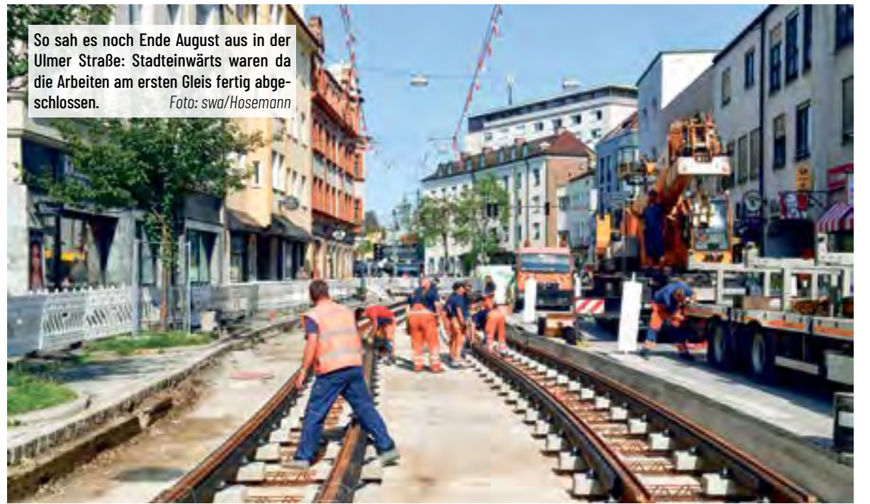
So sah es noch Ende August aus in der Ulmer Straße: Stadteinwärts waren da die Arbeiten am ersten Gleis fertig abgeschlossen.