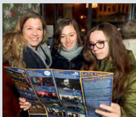
Einstieg in einen Abend voller Live-Musik: Begeisterte Riegele Honky Tonk-Besucherinnen beim Planen ihrer Tour mit Easy Listening im Heyzel Coffee am Rathausplatz (links) und beim ausgelassenen Mitsingen in der Bar Italy (rechts).