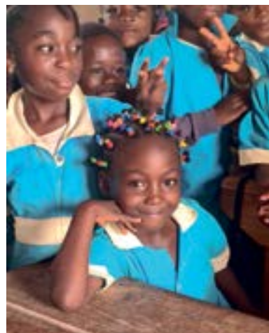
Ein aktuelles Stiftungsprojekt ist eine Primary School in Syangeni in Kenia.