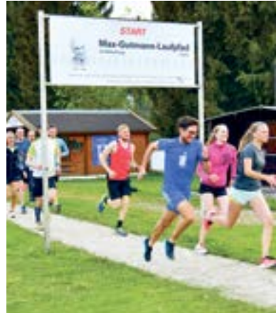
Der Max-Gutmann-Laufpfad ist während der Winterzeit beleuchtet.

Rund 50 bis 150 Jogger und Walker sind allabendlich auf dem Laufpfad unterwegs, auch die Top-Läufer und Top-Triath-