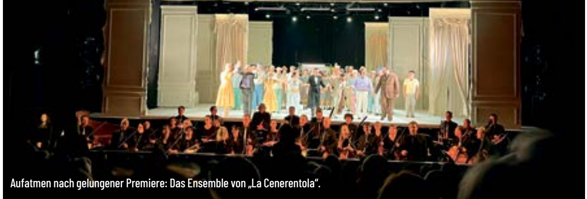
Aufatmen nach gelungener Premiere: Das Ensemble von „La Cenerentola“.