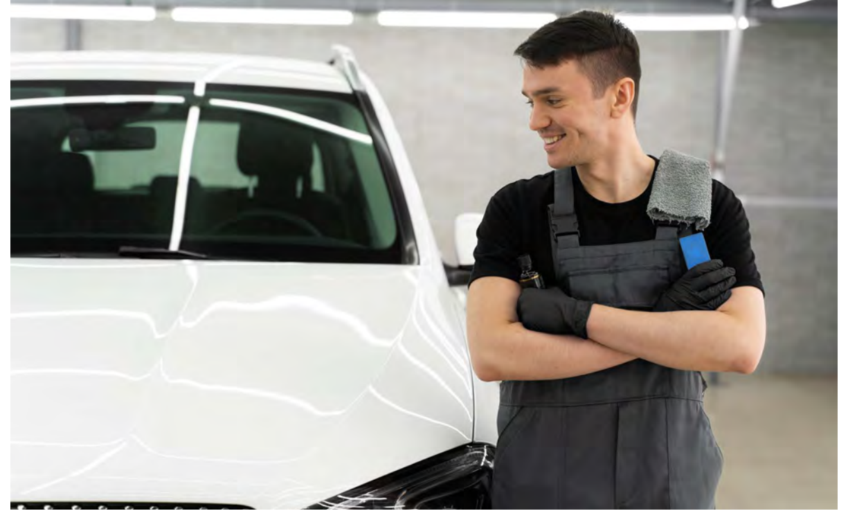
So klappt es auch für ihr Auto mit dem perfekten Start in den Frühling: der ACV gibt fünf Tipps zur Pflege und Sicherheit.

Anschließend sollte das Auto gut durchgelüftet werden, damit alle Flächen vollständig trocknen. Das zusätzliche Aufstellen