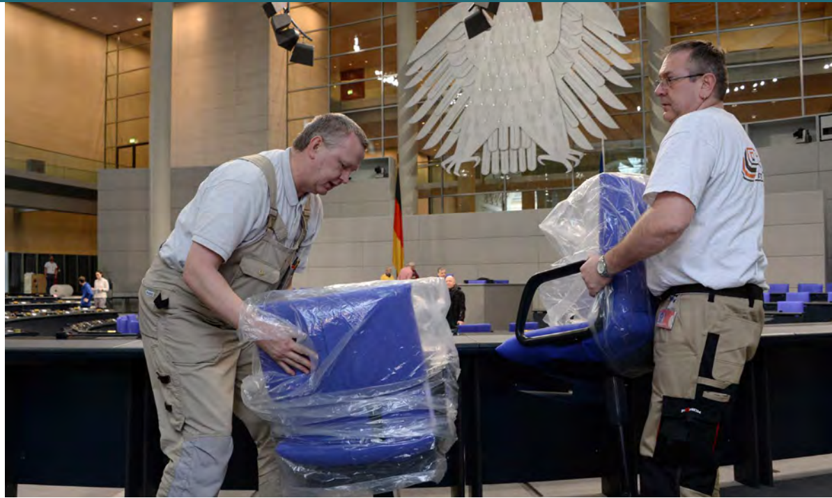
Nach jeder Wahl beginnt im Bundestag in Berlin erneut das Stühlerücken. Diesmal werden über 100 Plätze abgebaut.