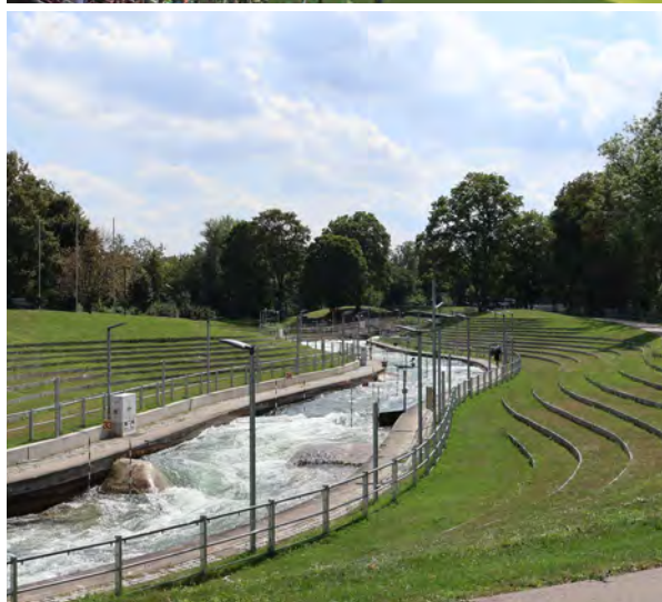
Von den Fuggern (li. oben Fuggermuseum) über den FC Augsburg (re. oben) und das Friedensfest (li. unten) bis zum UNESCO-Weltkulturerbe, zu dem auch die Kanuslalom-Strecke zählt (re. unten), all das ziehe Touristen in die Fuggerstadt.